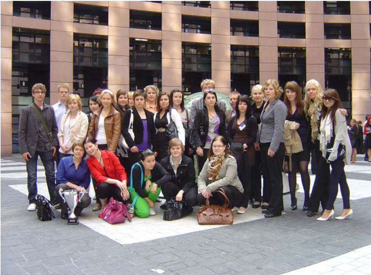
Varkauden lukion opiskelijoita opintomatalla Strasbourgissa 2008

Varkauden lukiossa uusina toimintamuotoina ovat olleet erilaiset projektit. Koulu oli mukana 1990-luvun loppuvuosina valtakunnallisessa LUMA-hankkeessa, jonka tarkoitus oli tehostaa luonnontieteiden ja matemaattisten aineiden kokeellista opetusta. Suomen jäsenyys Euroopan unionissa avasi mahdollisuuksia myös kouluille. Varkauden lukio toteutti yhdessä irlantilaisen ja italialaisen lukion kanssa musiikkiteatteriprojektin vuosituhaten vaihteessa. Osana kielten opiskelua ja kansainvälisyyskasvatusta Ranskan, Saksan ja Espanjan opiskelijat ovat tehneet lähes vuosittain leirikoulumatkoja. Yhteiskuntaopin valinnaiskurssi "Eurooppalaisuus ja Euroopan unioni" -ryhmä osallistui vuoden 2008 keväällä Euroopan unionin rahoittamaan Euroscola-hankkeeseen ja vieraili opintoretellä Strasbourgissa.