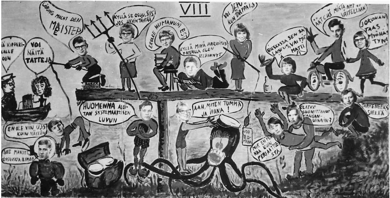
Osa Kuoppakankaan Yhteiskoulun freskosta vuodelta 1964

Kuoppakankaan yhteiskoulun lukiolaiset omaksuivat perinteitä Varkauden yhteislyseolaisilta, tosin karsitussa muodossa. Abiturientit tekivät ainakin vuodesta 1964 lähtien ennen koulusta lähtöä yhteisen ison freskon, jossa oli jokaisesta abiturientista ja luokanvalvojasta valokuva ja henkilön luonnetta tai ominaisuuksia kuvaava naseva teksti.