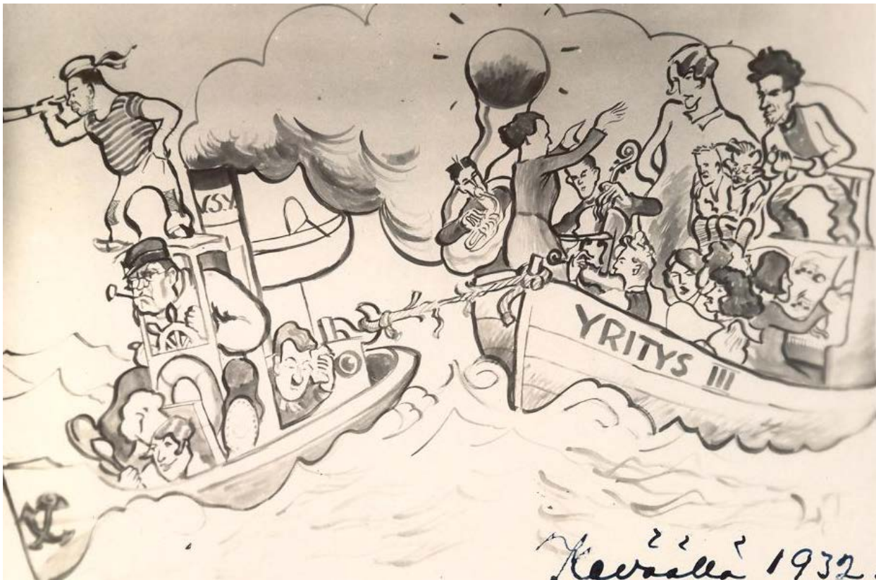
Varhaisimpia freskoja Varkauden Yhteiskoulusta vuodelta 1932