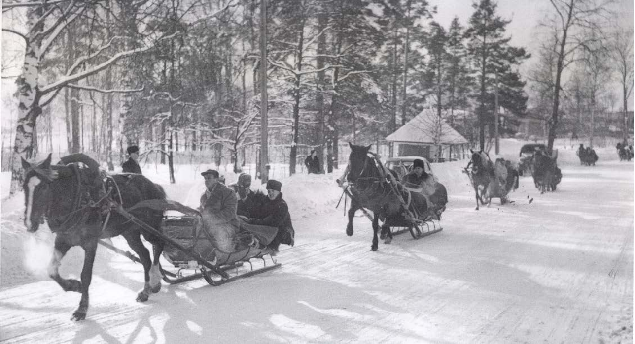
Varkauden Yhteislyseon abit penkkariajelulla 1960-luvun alussa

Merkittävä perinne oli tietysti myös abiturienttien penkinpainajaiset. Ensimmäinen maininta koululla järjestetyistä potkukonvan jälkeisenä päivänä pidetyistä penkinpainajaisista eli penkkareista on lukuvuodelta 1967–68. Koulutiloissa pidettyjen penkkareiden traditio jäi lyhyeksi. Kouluhallitus lähetti 1970-luvun alussa kouluille kirjeen, jossa todettiin, ettei koulu ole valvontavastuussa penkinpainajaisista. Syytä "paimenkirjeeseen" voi arvailla. Selitys saattaa piillä vuodessa 1969 ja keskioluen vapauttamisessa eli myynnin sallimisessa tavallisissa ruokakaupoissa. Tämä siirsi ainakin alkoholipitoisen penkkariohjelman pois koulun tiloista. Tämän jälkeen abiturientit vuokrasivat jonkin suurehkon tilan, missä järjestivät penkkarinsa.