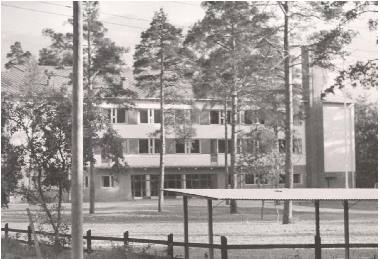
Varkauden Yhteislyseon uusi koulurakennus kesällä 1956