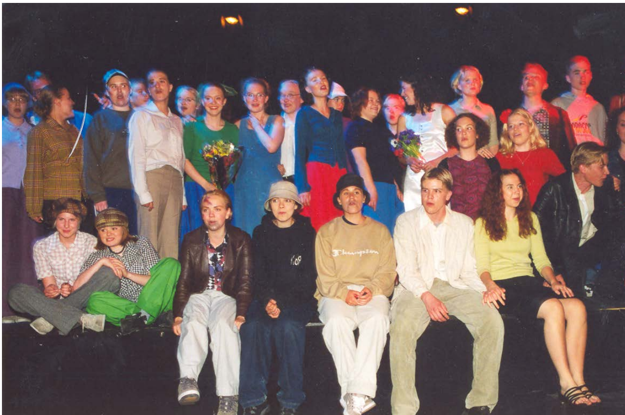
Varkauden lukion opiskelijoita Showtime-musiikkiteatteriesityksen jälkimainingeissa 2002

Teatteritaiteessa tapahtui aktivoituminen 1990-luvun alussa. Lukuvuoden 1990–91 joulukuussa koulun näytelmäkerho esitti "Pikku prinssin". Näytelmä sisälsi myös oppilaiden esittämää musiikkia. Lukuvuonna 1992–93 lukion ilmaisutaidon ryhmä esitti näytelmät "Skin" ja Ulle Vaarnamon "Zikhi bara nastar".